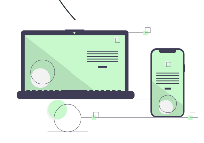
CMA - Câmara Municipal de Aveiro